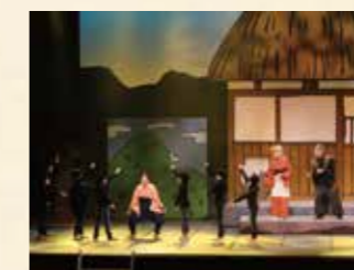
2017年 桃から生まれた物語