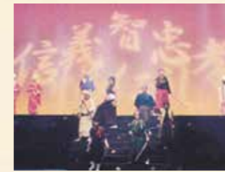
2010年 チャンバラ☆ミュージカル八犬伝