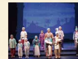
2022年 千一夜物語〜アラビアンナイト〜