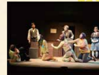
2012年 宮沢賢治 宛名のない手紙