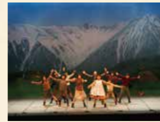
2009年 アルプスの少女ハイジ