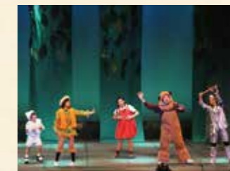
2013年 ドロシーからの手紙