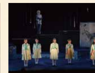
2006年 不思議の国のアリス