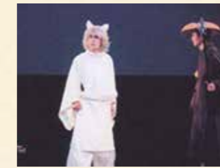
2011年 チャンバラ☆ミュージカル早太郎伝説