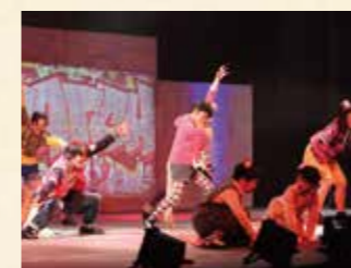
2015年 くまねずみタータの冒険